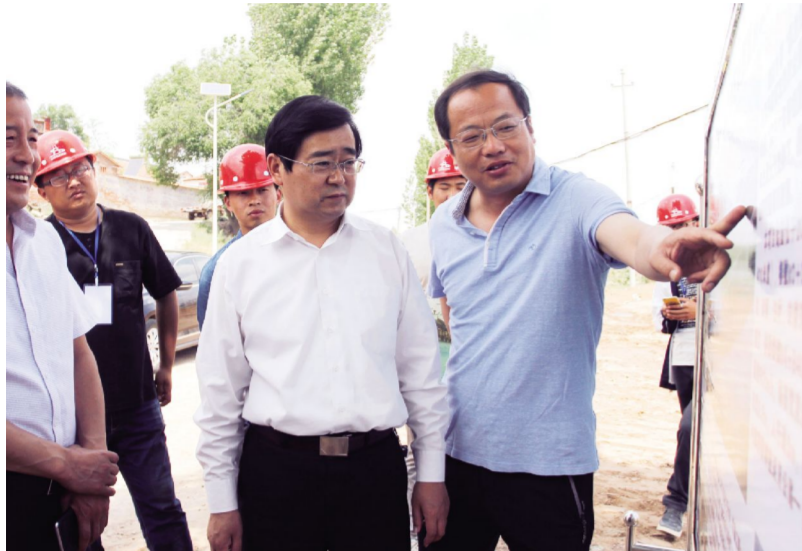
县委书记卢展明调研基础设施建设