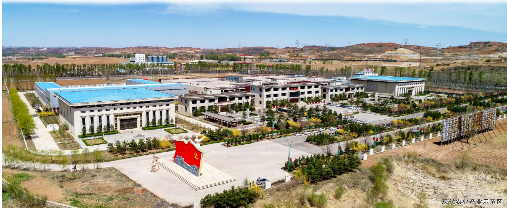
现代农业产业示范区

群山翘首，漳水激越。站在全面建设社会主义现代化国家的历史新起点，在习近平新时代中国特色社会主义思想的指引下，18万老区人民高奏脱贫攻坚雄师乐章，大力实施乡村振兴战略，同心同德，顽强奋斗，向着实现高质量发展、高品质生活的美好梦想再出发！