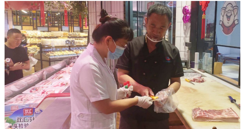
县疾控中心工作人员深入各农贸市场、肉联厂和食品批发、零售市场进行冷链食品新冠病毒采样及核酸检测。