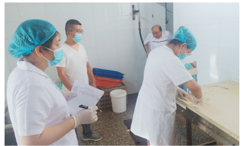
县市场监管局和畜牧中心工作人员在冷库检查贮存条件,确保食品冷冻冷藏符合温控标准。