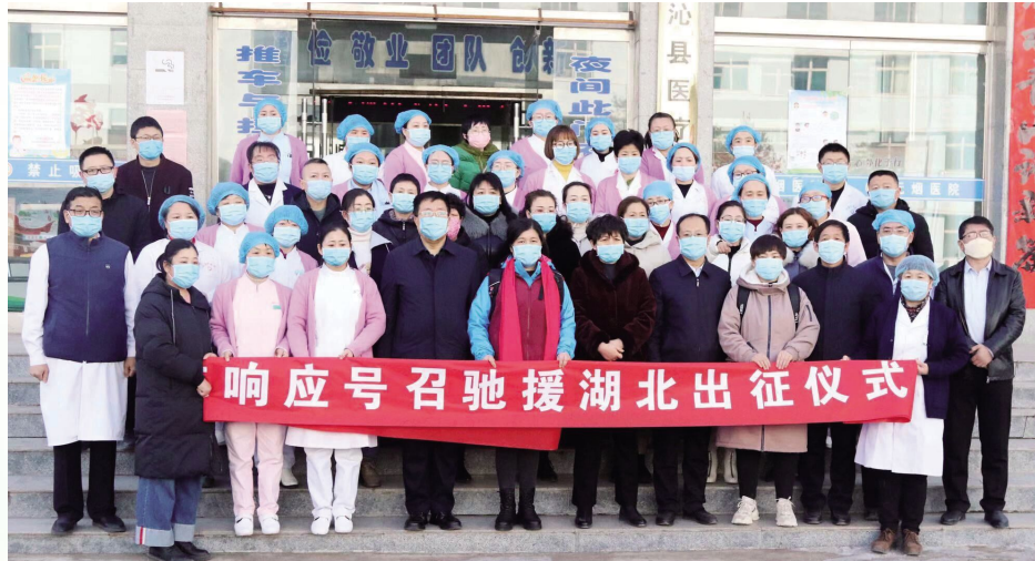
响应号召驰援湖北出征仪式

没有全民健康，就没有全面小康。2019年以来，县卫生健康和体育局在县委、县政府的领导下，不断深化医药卫生体制改革，圆满完成各项目标任务，有力推动了全县卫生健康体育事业的健康和谐、可持续发展，总体工作亮点纷呈。