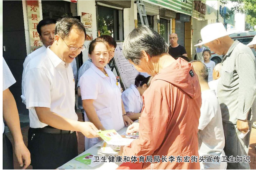
卫生健康和体育局局长李东宏街头宣传卫生知识