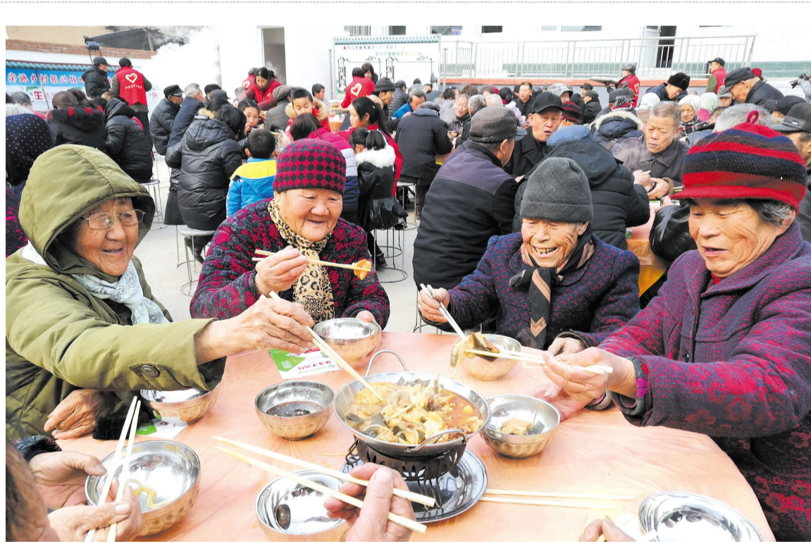
大年三十,恰逢定昌镇北寺上村每月一次举办“孝道文化大餐”的好日子。100多位65岁以上的老人欢聚在村活动场所,共同度过了一个别样的新春佳节。

培训会上,省委党校社教部教授王小军对《中国共产党支部工作条例(试行)》和《中国共产党农村基层组织工作条例》进行了讲解。