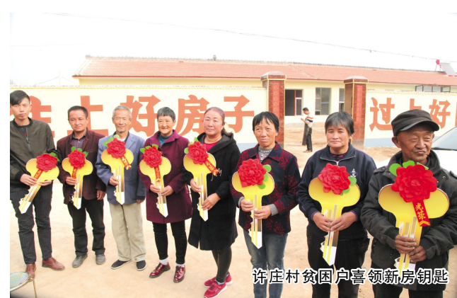
许庄村贫困户喜领新房钥匙

为了贫困户住得下,留得住,发展的好,在杨安乡党委政府的支持下,许庄村和张家沟村成立了联合党支部。并连同杨安乡10个贫困村和2个非贫困村共同成立了同顺富专业合作社,带动全乡贫困户脱贫致富。同顺富专业合作社首先在许庄村种了20亩朝天椒,为了增加收益,延伸初级产品产业链,结合当地妈妈们有着制作辣椒酱的传统手艺,便推出瓮城红“妈妈味”辣椒酱。“现在辣椒酱的卖的还不错,帮扶单位和很多亲朋好友都在积极购买,好的产品一定能经得起市场的考验。”杨安乡工作人员告诉记者。