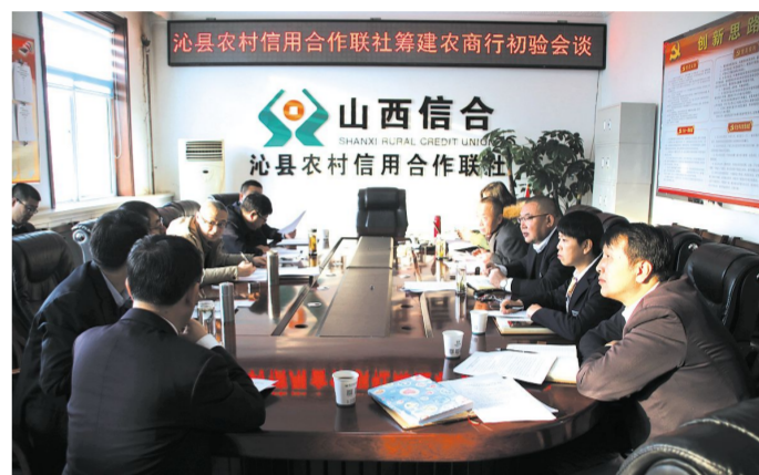
图为省市县各级部门领导关心和帮助改制化险工作

从前期准备到初验完成;从资金盘子敲定到全市11家农商行达成入股2.2亿元协议;从清产核资到6.2亿元资金入账化解不良;从成立筹建小组到筹建申请受理,改制进入最后“冲刺”阶段。上级领导的一次次调研座谈,定措施想办法、跑资金要政策,为农商行改制指明了方向;县委政府一次次召开周例会、月例会、常务会,解困难、给资金,为农商行改制增强了动力;县联社领导一次次废寝忘食的“跑上跑下”沟通协调资金和政策,为农商行改制注入了信心。截止2017年12月末,全辖资产总额318977万元,负债总额311122万元,所有者权益余额7855.82万元。各项存款余额271054万元,较年初增加27009万元。各项贷款余额138609万元,其中,涉农贷款余额138407.29万元,全辖实现经营利润4326.15万元。