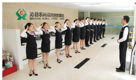
图为服务礼仪精品形象展示

“服务形象提升”是树品牌、聚人心、保发展的长远工程。2017年,沁县农信社百倍付出、寻找出路,按照“内强素质、外塑形象”的总体思路,改造精品网点,优化服务水平,提升员工素质,在形象和服务上实现了“脱胎换骨”的转变。