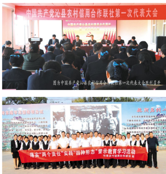
图为全体党员在小东岭廉政教育基地参观学习