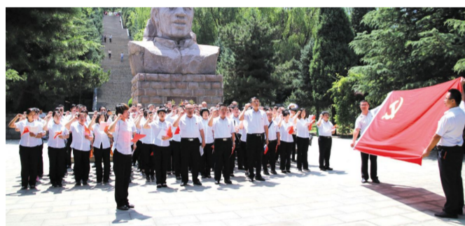
图为全体党员赴大寨进行党建专题教育学习

党旗红,人心齐,士气昂,农信兴! 作为全省党建工作示范点,2017年,沁县农信社高举党旗、砥砺前行,以党建引领凝心聚合力,以党建引领促发展强根基,真正打造先锋带头、敢于冲锋陷阵的“战斗堡垒”,再谱沁县农信社新辉煌!