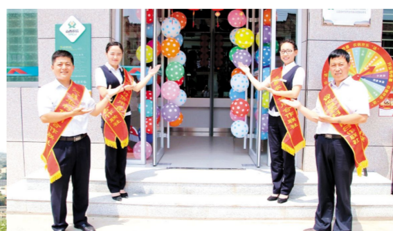
图为沁县农信社新网点开业