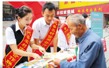
图为为百姓宣传讲解金融知识