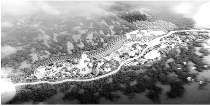
走马岭旅游开发鸟瞰图