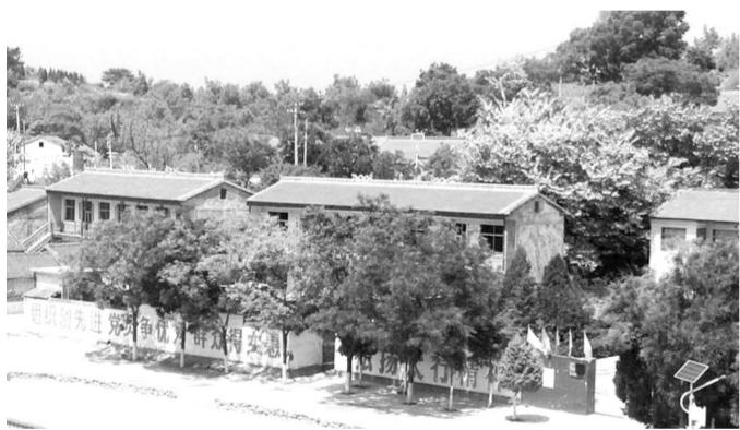
红色教育基地佛堂岩村容