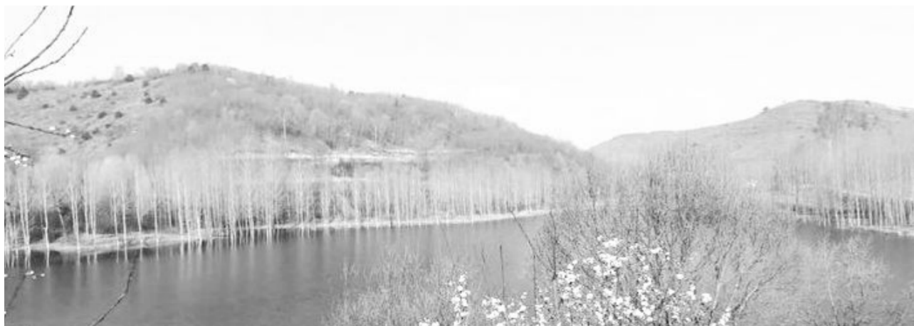
露营野炊首选地——韩庄清杨湖