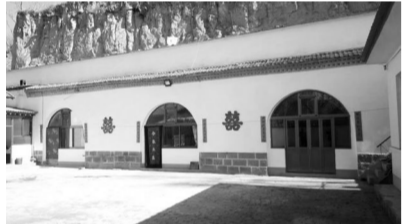
知识青年下乡住村点