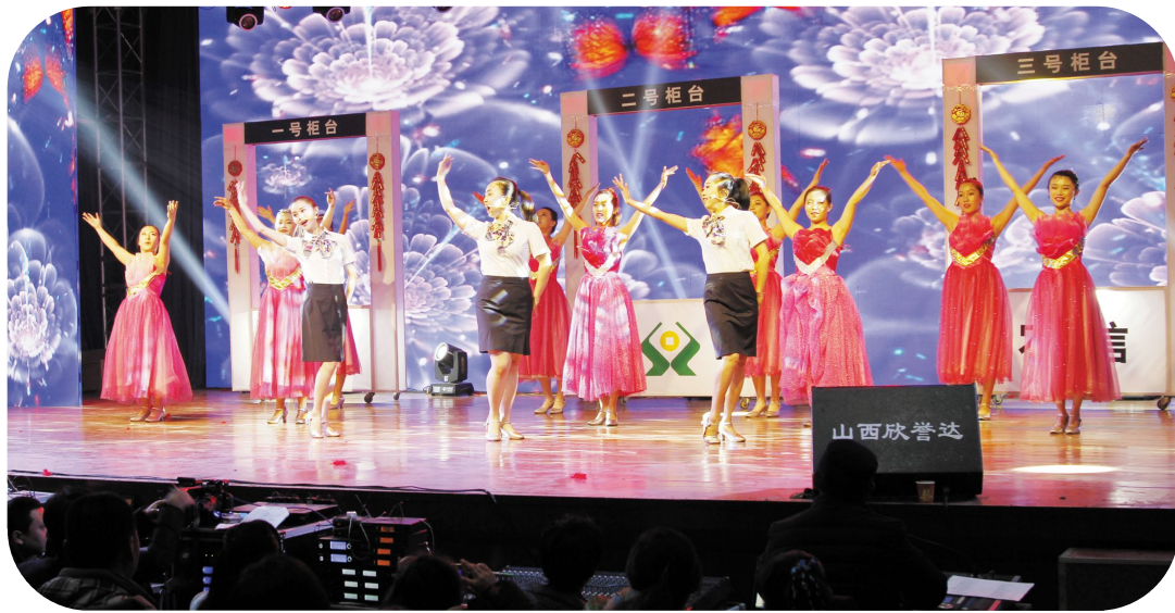
音乐剧《手牵手的承诺》

“古韵新风赞沁州”2017迎春文艺晚会在喜气洋洋的开场舞《盛世欢歌》中拉开帷幕，配乐诗朗诵《榜样的力量》表现了我县“沁州好人”“道德榜样”“百姓公仆”用言行弘扬了善行，播撒出真情，践行着社会主义核心价值观的感人情怀；小品《第一书记》讲述一位县委选派的“第一书记”扎根农村，带领全村人们克服困难，通过修路打通“脱贫”路，实现精准扶贫的故事，情节的设计让观众感动颇深；首届瓮城山生态文化旅游节主题曲《请脚步慢下来》表达了我县彰显地方特色，依托乡村旅游，打造国体休闲度假胜地；非遗节目三弦书、音乐剧、快板、民歌轮番上演，为春晚舞台增添了浓浓的年味；男声独唱《国泰民安》、小品《回家吃饭》、相声《跟风》将晚会推向一个又一个高潮，让观众在浓厚的艺术氛围中感受家乡的变化，感恩伟大的祖国。