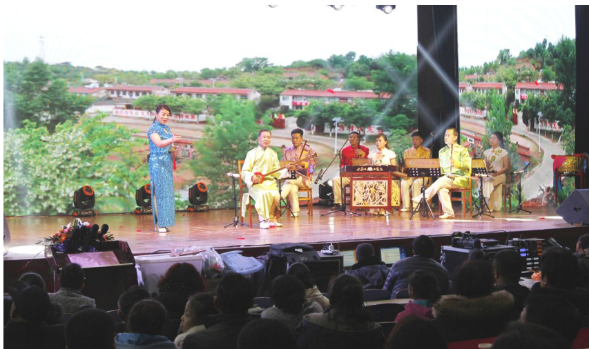
沁州三弦书《山村头雁》