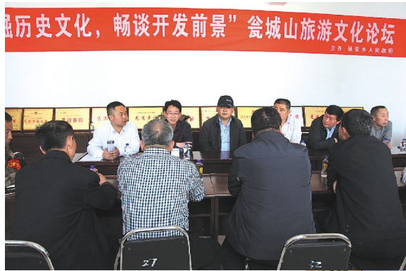
左图为杨安乡党委政府召开瓮城山旅游开发文化研讨会