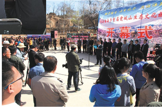
右图为首届瓮城山文化旅游节开幕式现场