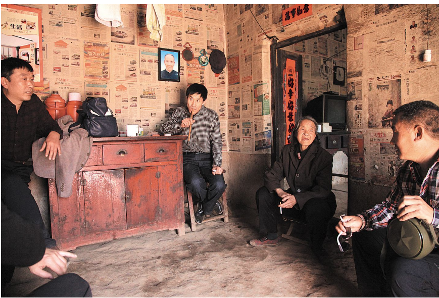
来自市区的多名游客在农户家中体验生活