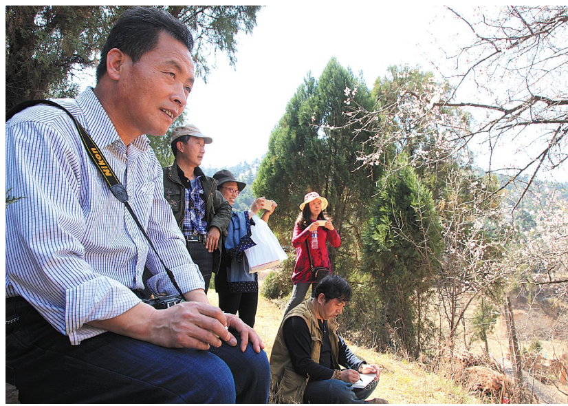
原生态村庄吸引摄影家和书画家驻足