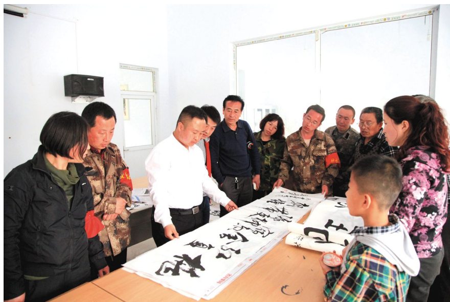
旅游节期间，县内部分书法家亲临现场挥笔泼墨