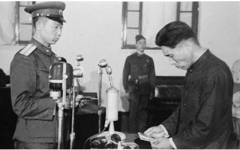
曾在沁县小河村、暖泉村制造杀人惨案的日本战犯住刚又一在太原接受审判。