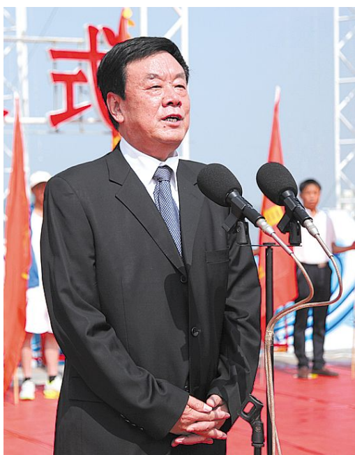
长治市委副书记、市长王慧杰在启动仪式上致辞