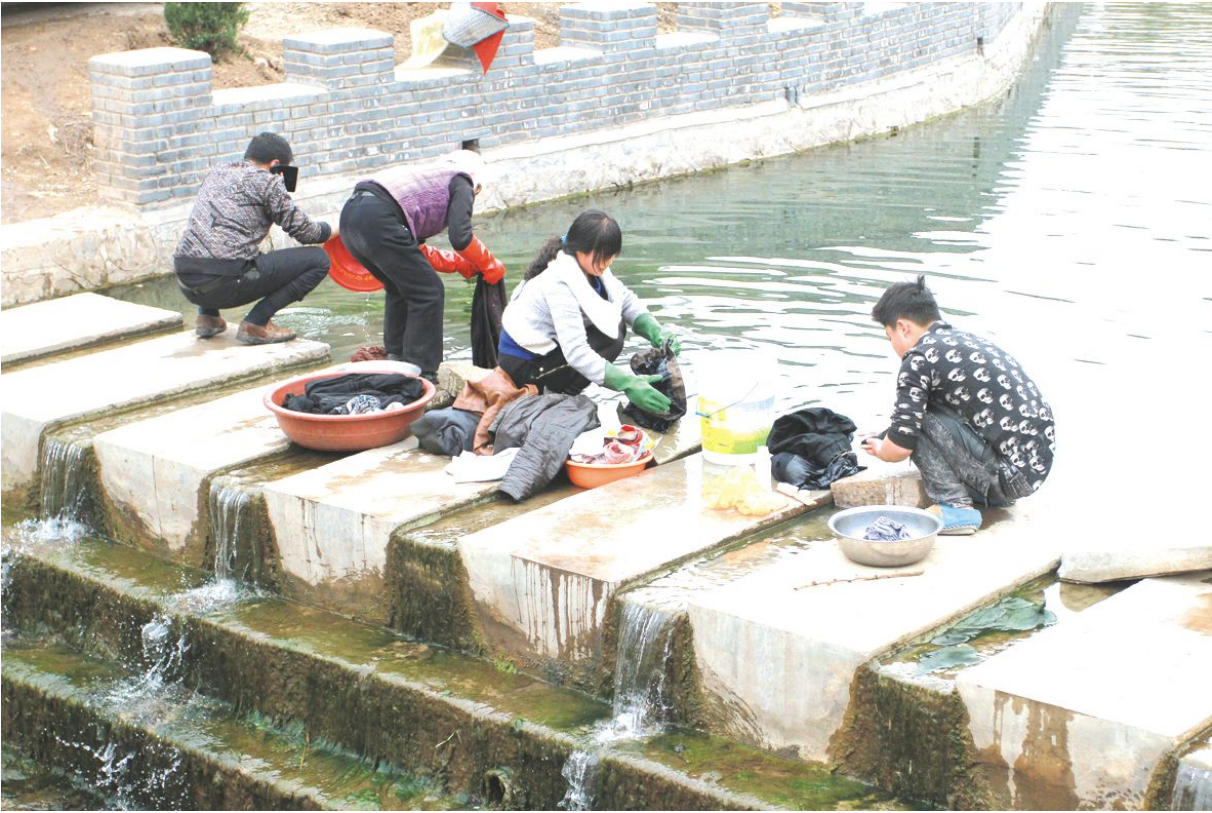
位于沁县漳源镇的漳源村,由漳河之源得名。在这里,这个几乎家家户户都有洗衣机的年代,村民们还是习惯每天都聚在河边谈笑、浣衣。漳河源头的水是泉水,冬暖夏凉,清澈甘冽,一年四季都会流淌。图为村民们在河流下游处边说笑边洗衣。