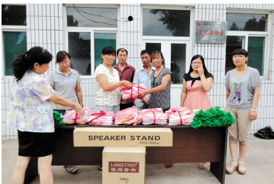
为北城村妇女捐赠文体器材