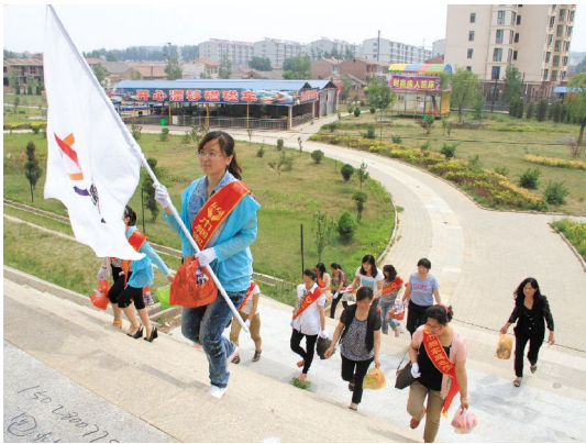
巾帼志愿者学雷锋活动