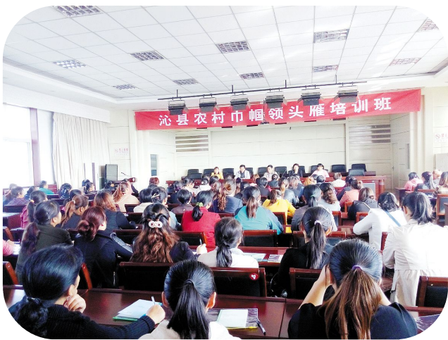
农村巾帼领头雁培训