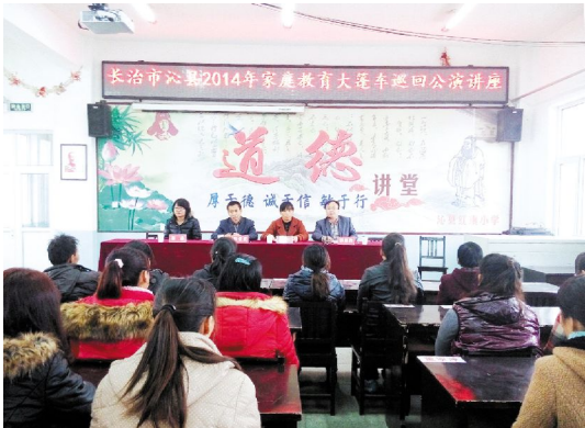
家庭教育大篷车巡回讲座