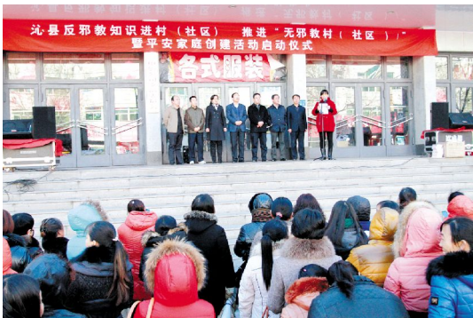
反邪教知识进村(社区)暨平安家庭创建活动启动

六、进一步推进妇联组织建设。围绕加强和改进党的群团工作,进一步拓宽和创新广泛联系妇女、有效服务妇女的工作载体、渠道和手段,努力提升服务型妇联组织建设水平。加强基层妇联组织建设,以全县第十届村级换届为契机,通过实行村“两委”女干部和村妇代会主任交叉任职的方式,选好配强村妇代会主任,扎实选好配强村级妇代会组织,抓好第十届村“两委”女委员、村妇代会主任培训工作。加强对“妇女之家”的分类指导,制定“妇女之家”示范点管理办法,加强对薄弱“妇女之家”的指导和帮扶力度,确保基层妇女儿童“有家可依”。深入推进妇联干部工作作风转变,各级妇联组织要主动适应从严治党 and 作风建设新常态,认真践行“三严三实”要求,持续抓好党的群众路线教育实践活动、学习讨论落实活动各项整改措施和工作制度的落实。强化依法履职的法治意识,自觉用法治思维和法治方式谋划、部署和推进妇联工作,广泛开展“做一名学法、尊法、守法、用法的妇联干部”学习教育活动,提升妇联干部依法履职的能力和水平。健全直接联系妇女群众的工作机制,扎实开展“下基层、访妇情、办实事”活动。