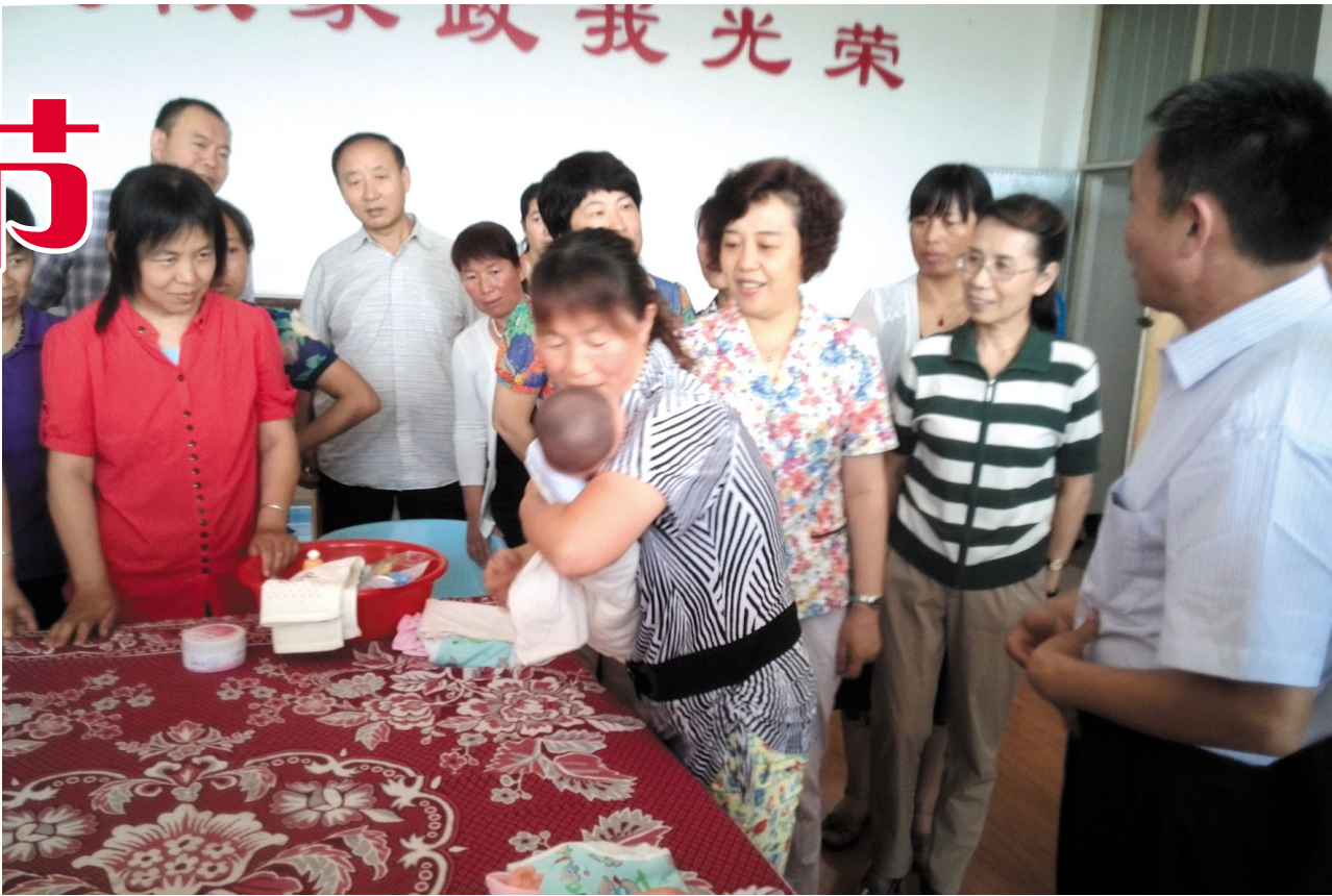
省妇联主席王维卿调研我县妇女工作